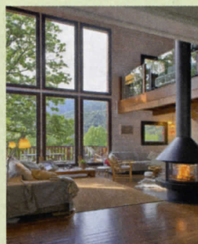
Foto portada: Interior de una vivienda construida con madera de Kuusamo.